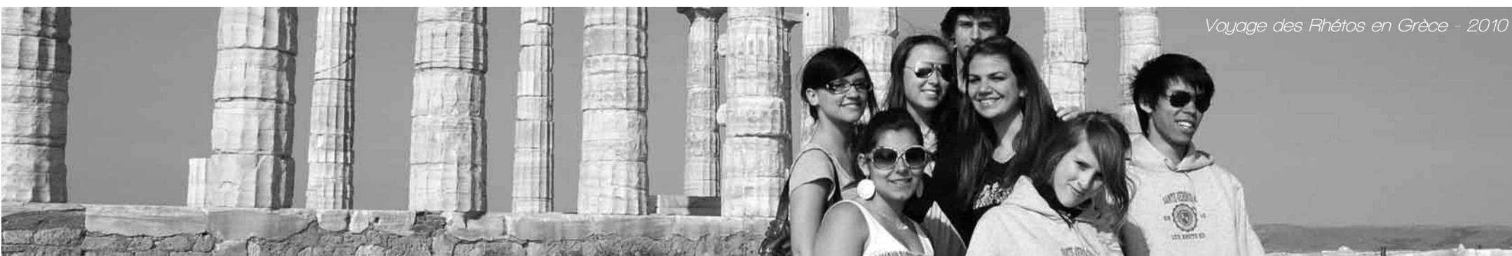
Voyage des Rhétos en Grèce - 2010

Cette expérience, inédite pour la plupart des étudiants, a été particulièrement appréciée et restera certainement dans les mémoires comme une après-midi aussi agréable qu'instructive.