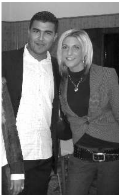
Les élèves prêts pour leur interview...

Nous sommes toujours étonnés de leur disponibilité et pourtant... c'est unique à Liège !