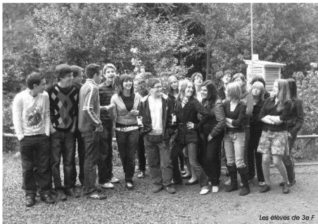
Les élèves de 3 e F

Par ailleurs, plusieurs autres participants ont reçu un diplôme individuel mentionnant leur « DISTINCTION ». Le moins que l'on puisse dire... c'est que la nouvelle était vraiment fantastique !!! BRAVO à tous.