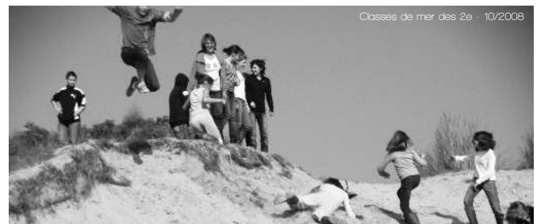
Classes de mer des 2e - 10/2008